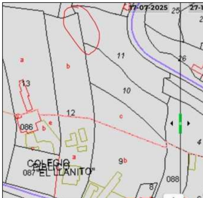
Fig. 3. Consulta a la web https://www.geamap.com/es/catastro-historico (27/10/2025)

Analizando la cartografía del “Catastro Histórico”, se aprecia un cambio en el mes julio del presente, aparentemente el propietario de la parcela catastral nº 12 realizó una rectificación, cediendo más metros a la parcela 11 (separándose). Siendo la parcela catastral 11 la numerada como 4 en el proyecto, que se corresponde con la referencia catastral 38008A026000110000QR.