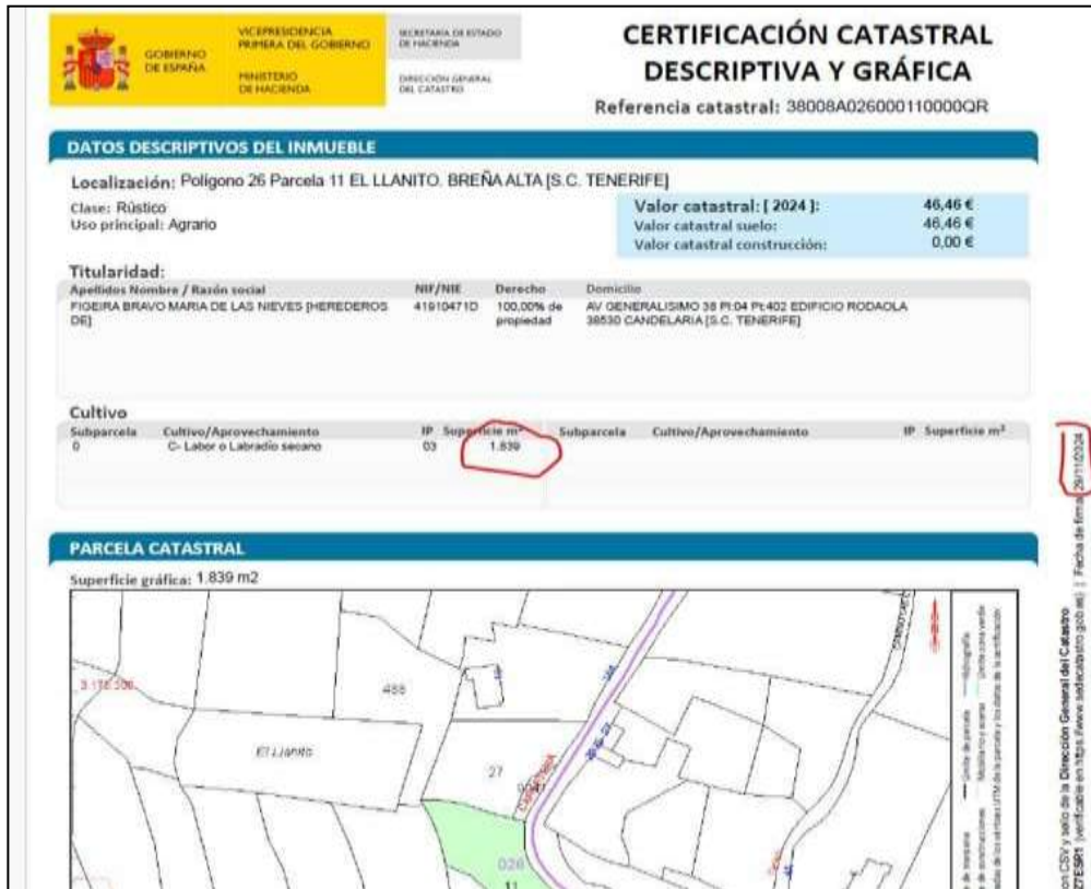
Fig. 1. Extracto Certificación Catastral 29-11-2024

En cambio, los datos catastrales para la elaboración de documentos más recientes, arrojan una superficie de 1853 m 2 , superficie que coincide con la consultada en catastro a la fecha actual.